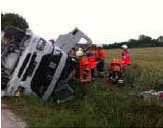
Einsatz: Eingeklemmte Person