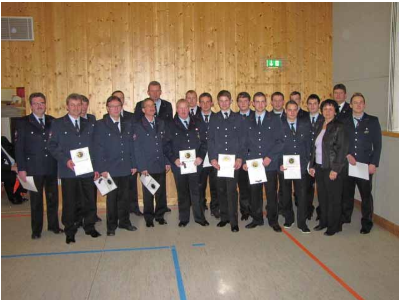
Gruppenbild mit allen geehrten und beförderten Kameraden